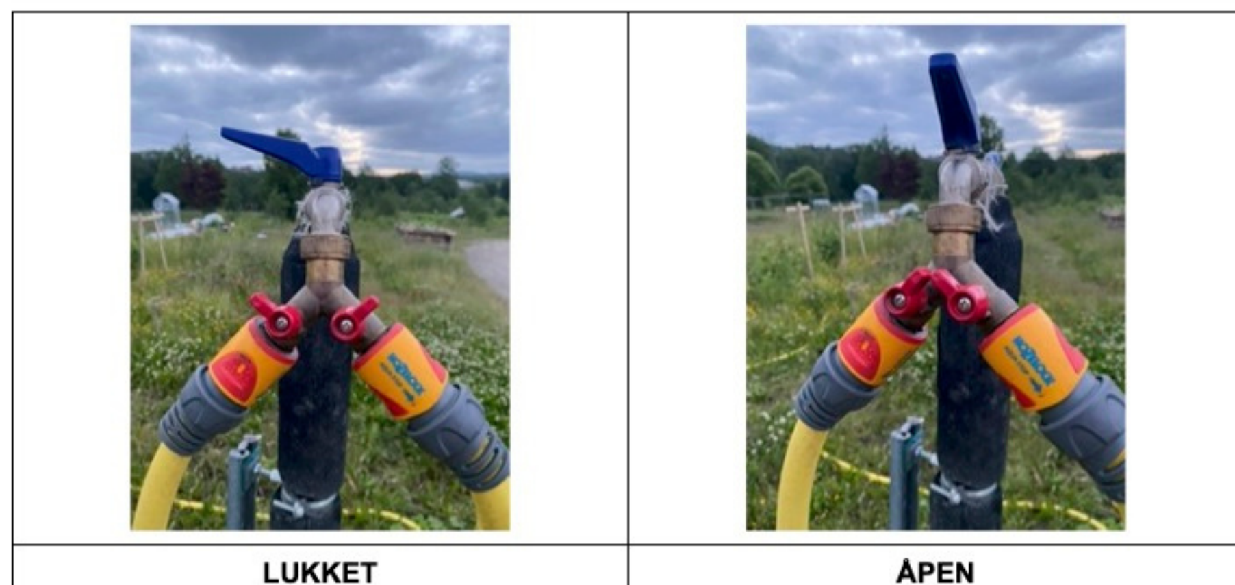
Kran m/ 2-veisfordeler:

LUKKE: Hendel/ventil på tvers av slange/kran. ÅPNE: Hendel/ventil på linje med slange/kran.